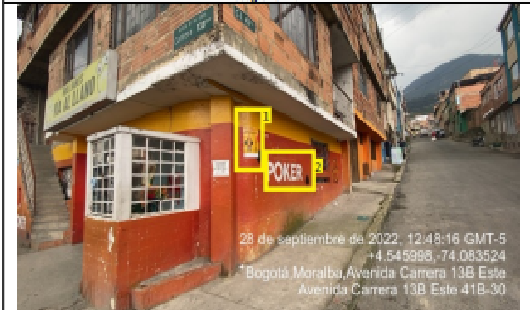
Fotografía No. 4

En la cual se evidencian dos (2) elementos PEV con orientación visual sobre la calle 42 Sur, pertenecientes al establecimiento comercial denominado BILLARES VIA AL LLANO, los cuales son adicionales al único elemento permitido por fachada de establecimiento comercial.