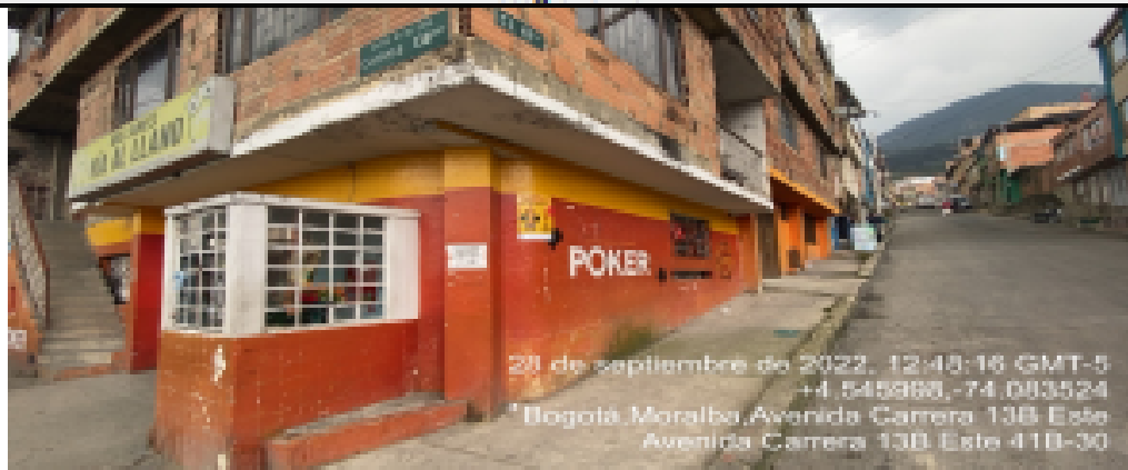
Fotografía No. 1

En la cual se evidencia la fachada del establecimiento comercial denominado BILLARES VÍA AL LLANO, en la CR 13 B Este No. 41 B – 28 Sur en la localidad de San Cristóbal.