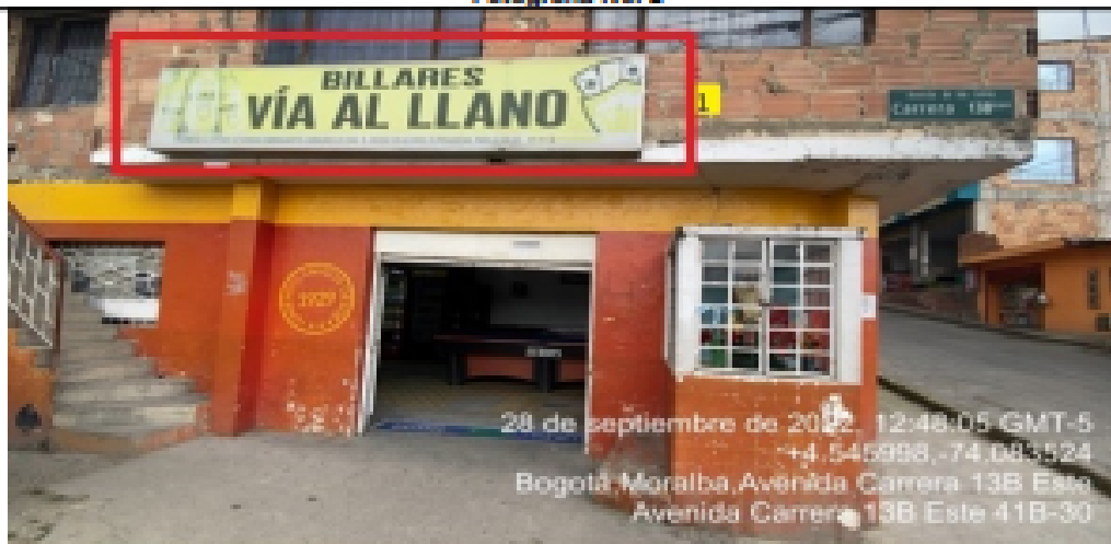
Fotografía No. 2

En la cual se evidencia un elemento tipo aviso en fachada con orientación visual sobre la carrera 13B Este ubicado en antepecho de segundo piso perteneciente al establecimiento comercial denominado BILLARES VÍA AL LLANO, al cual al momento de la visita se encontraba instalado sin el registro ante la SDA.